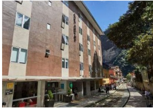
PUEBLO MACHU PICCHU // Casa Andina Standard Machu Picchu