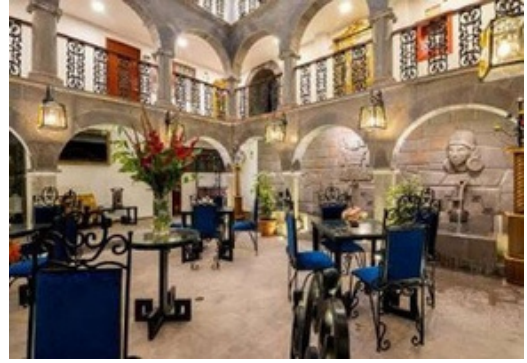
CUSCO // Hacienda Cusco Centro Histórico