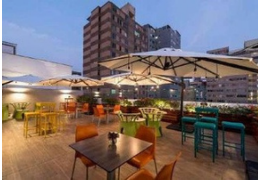
LIMA // Libre Hotel BW Signature Collection